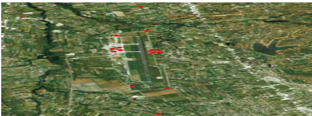
Figura nr.2 Pozicionet e monitorimit të zhurmave në aeroportin “Nënë Tereza”

Monitorimi i zhurmave kryhet mbi bazën e pozicioneve të konsideruara si më përfaqësuese dhe më strategjike brenda dhe jashtë zonës së aeroportit gjatë sezonit të pikut, si dhe jashtë tij. Matjet 24-orëshe u klasifikuan në tri periudha: orët e ditës 07:00-19:00, orët e mbrëmjes 19:00-23:00 dhe orët e natës 23:00-07:00 Matjet e zhurmave kryhen në përputhje me ligjin nr.9774, datë 12.7.2007 “Për vlerësimin dhe administrimin e zhurmës në mjedis” dhe me direktivën 2002/30/EC e Parlamentit European (PE) dhe Këshillit të BE-së të datës 26 mars 2002 për vendosjen e rregullave dhe procedurave në lidhje me përhapjen dhe kufizimin e zhurmave në aeroport. Gjatë këtij procesi u përdorën dy modele aparaturash për matjen e nivelit të zhurmave në pozicione specifike.