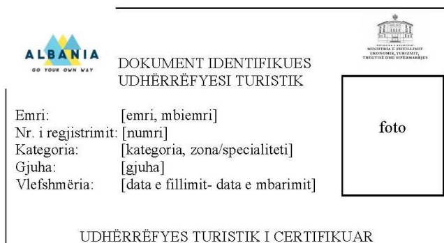
Fig. 2: Pjesa prapa